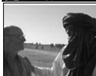
Le bonheur des retrouvailles