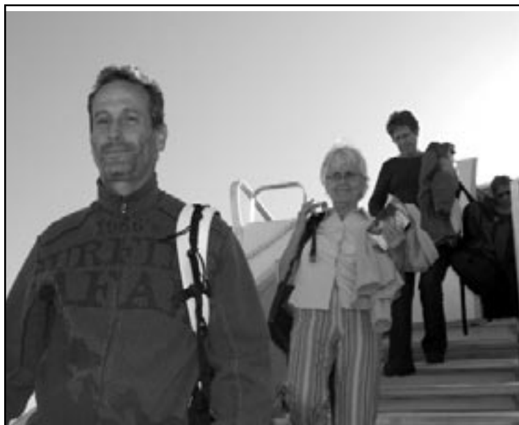
Les premiers touristes à leur descente d'avion, sur tous les visages se lit la joie d'être là