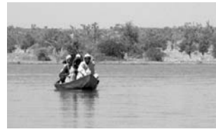
Le Niger, c'est aussi le fleuve qui coule au sud et traverse la capitale Niamey